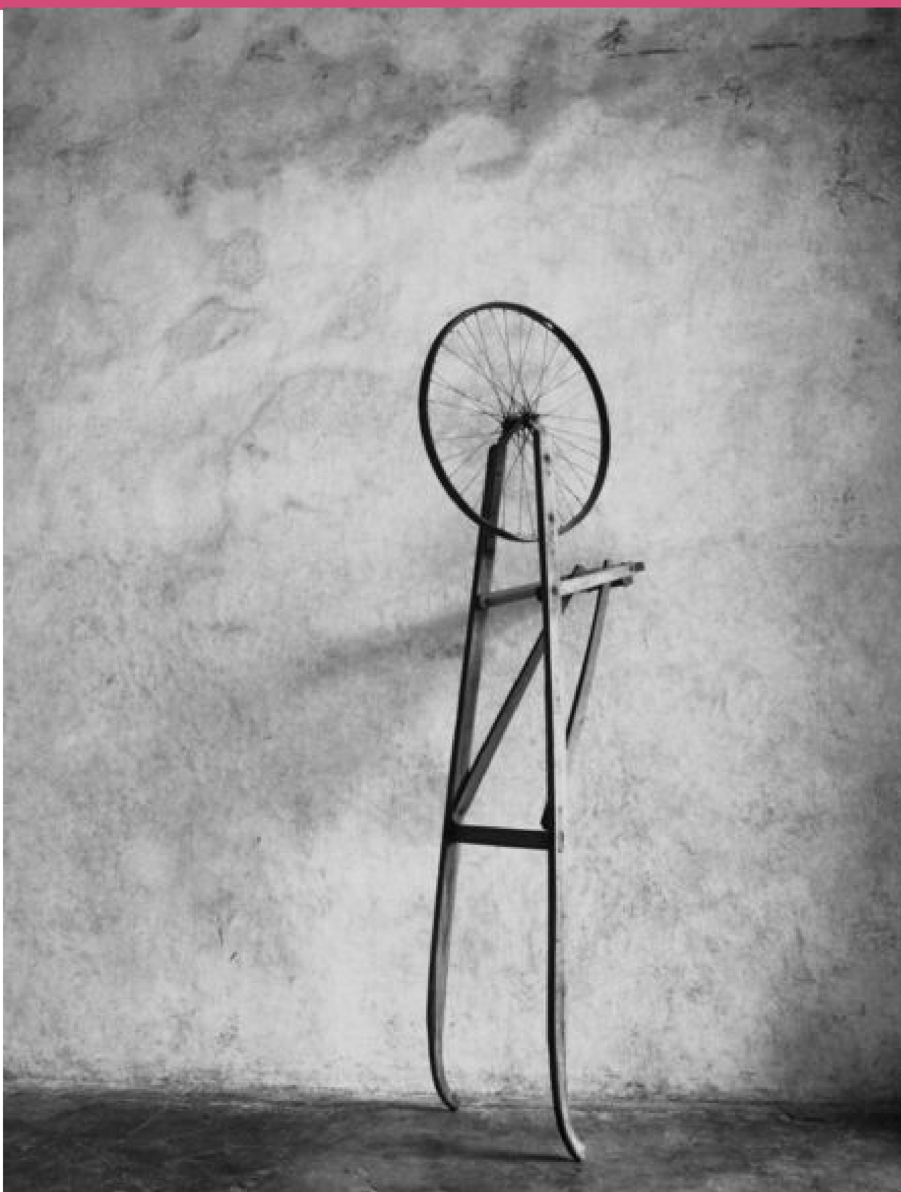
Autorretrato, 2014 Arqueología de Duchamp Flor Garduño

La fotografía construida ha permitido a las artistas capturar imágenes de espacios, mundos y personajes que, muchas veces, solamente existen en su imaginación.