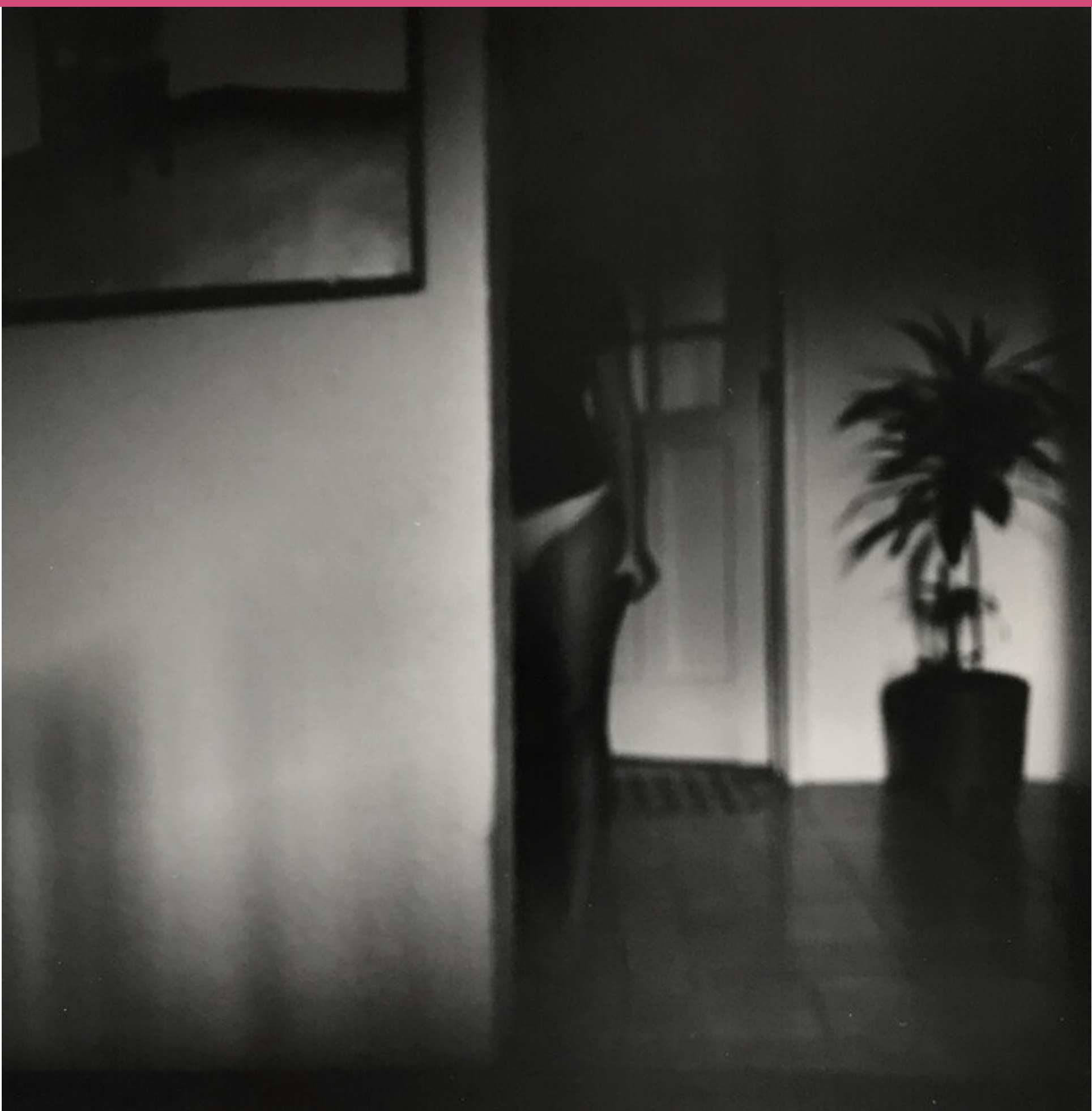
Condesa, 2004 Serie Lugares Paola Dávila

La calle ha sido el espacio idóneo para capturar eventos comunes e inesperados, sorprendentes y decisivos. El fotógrafo francés Henri Cartier - Bresson popularizó el término instante decisivo para referirse al momento exacto, a esa imagen perfecta y significativa.