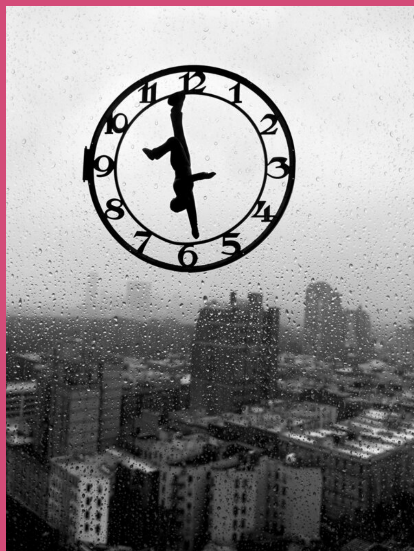
Homenaje a Winogrand, EUA, 2015 Flor Garduño Impresión plata/gelatina

En sus imágenes, Flor Garduño (1957) presenta objetos, paisajes y personas que se relacionan con dos elementos que se presentan suspendidos en espacios irreales: el círculo y el tiempo.