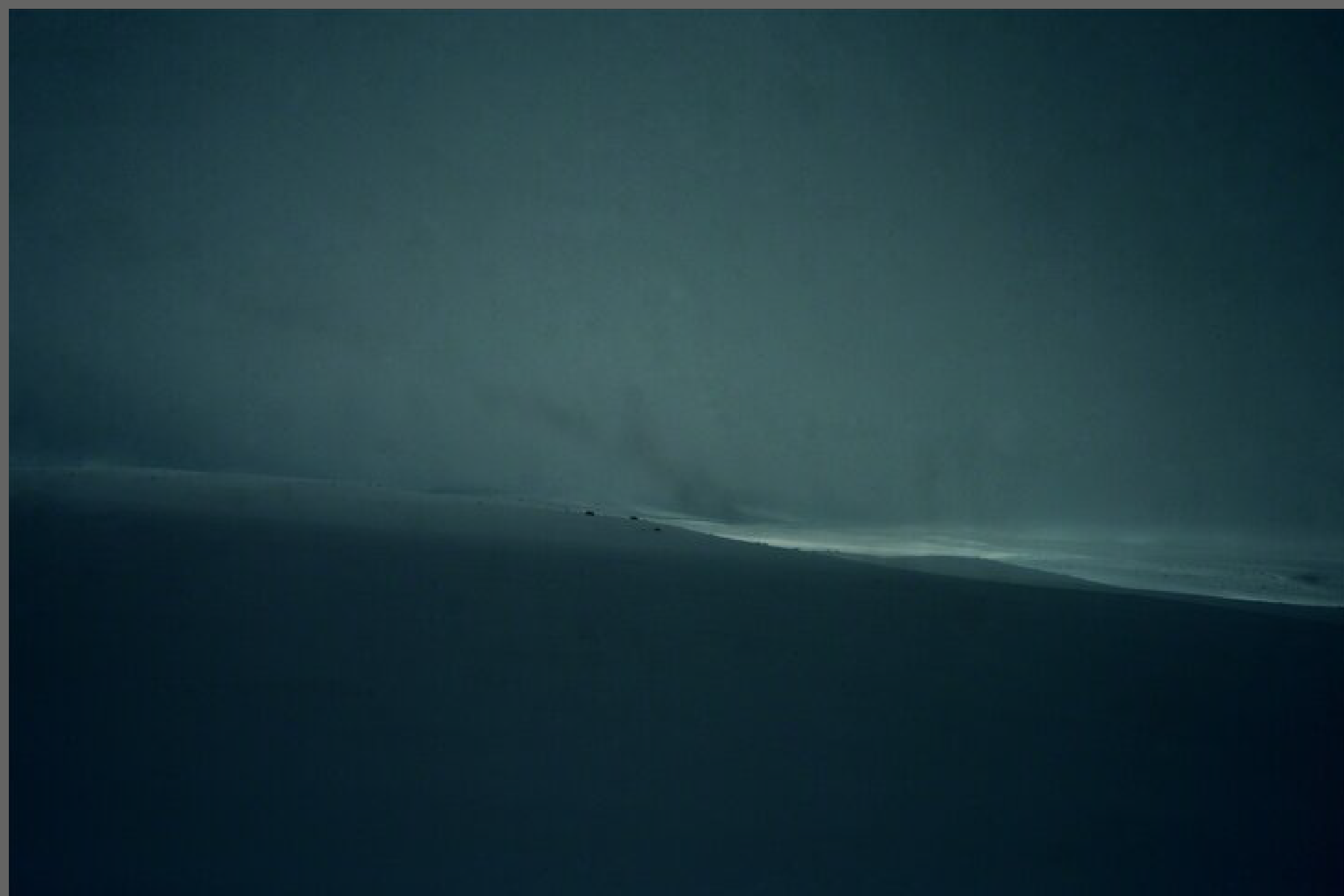
Sod, 2017 Cynthia (Araf) Serur Caja de luz

La fotografía es algo más que capturar un evento o un elemento de la realidad; también está sujeta a cómo la persona que la toma ve y entiende el mundo. A través de sus fotografías, Cynthia (Araf) Serur (1974) evoca lo que la naturaleza le produce al contemplarla.