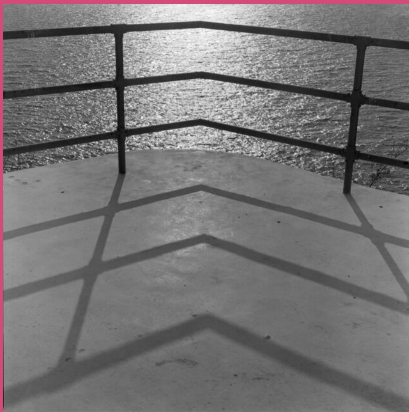
Casa Los Cuatro Vientos, 2019 Laura Cohen Impresión plata/gelatina

Durante un tiempo la fotografía pareció enfocarse en capturar la realidad; pero la experimentación y la creatividad de las personas la impulsaron hacia una representación no objetiva de las cosas, de tal modo que se alcanzó la abstracción.