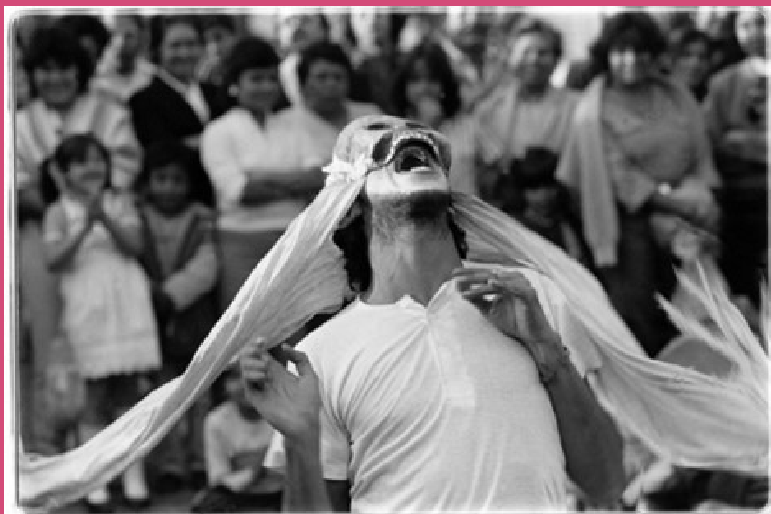
El grito, 1985 Yolanda Andrade Impresión fina inyección de tinta

La calle ha sido el espacio idóneo para capturar eventos comunes e inesperados, sorprendentes y decisivos. El fotógrafo francés Henri Cartier - Bresson popularizó el término instante decisivo para referirse al momento exacto, a esa imagen perfecta y significativa.