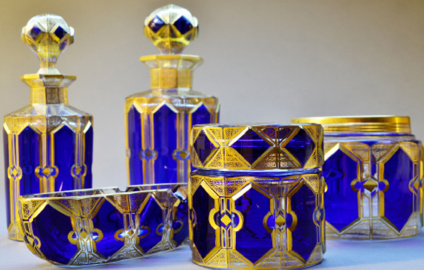
Juego de tocador (Pomadera, polvera, perfumeros y charola). Europa, mediados del siglo XX. Vidrio de doble capa (transparente y azul), cortado y dorado. Colección Arocena.

casa histórica arocena TORREÓN, COAHUILA, MÉXICO