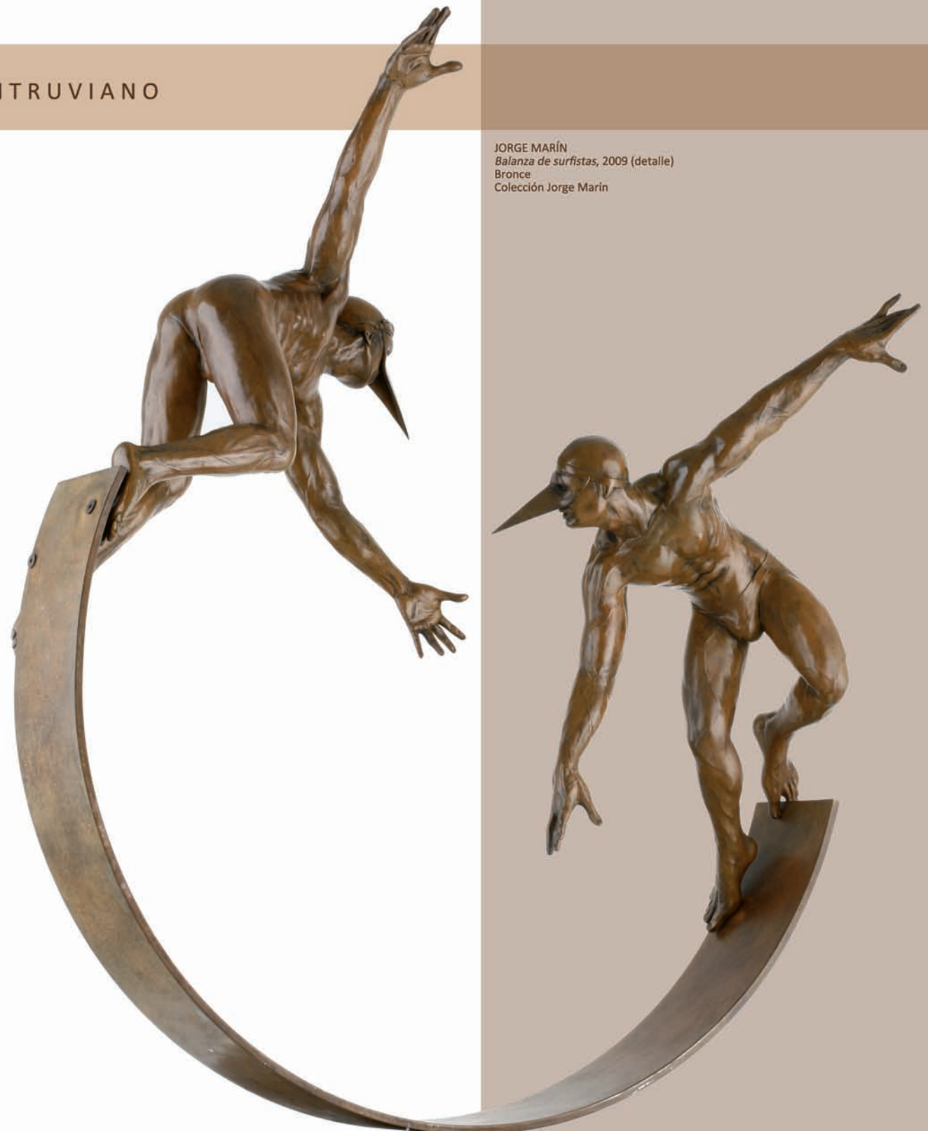
JORGE MARÍN Balanza de surfistas , 2009 (detalle) Bronce Colección Jorge Marín

Si bien es cierto que toda esta serie de cuerpos masculinos tiende a basarse en la efectividad de sus acrobáticas poses y de sus torneadas proporciones, también lo es que metafóricamente nos habla de someterse a la tentación del riesgo y la bíblica profecía de fallar y caer de este dudoso paraíso en el que vivimos.