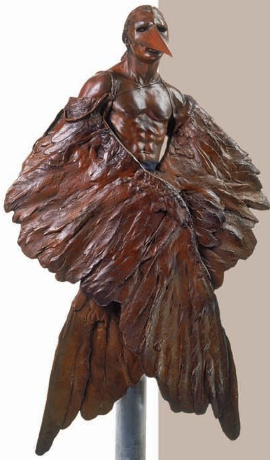
JORGE MARÍN La condición de Cirro , 2005 (detalle) Bronce Colección Jorge Marín

Años atrás, tal vez ya más de diez, escribí un breve texto que titulé —también apropiándomelo— Ojos que dan pánico soñar... en el que resaltaba su peculiar carácter, un tanto surrealista, divertido y perverso.